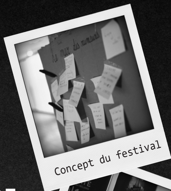
Concept du festival