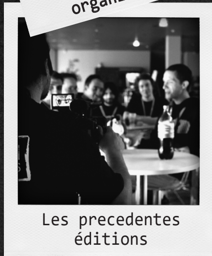
Les precedentes éditions