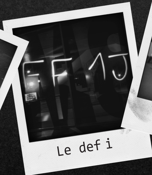
Le def i